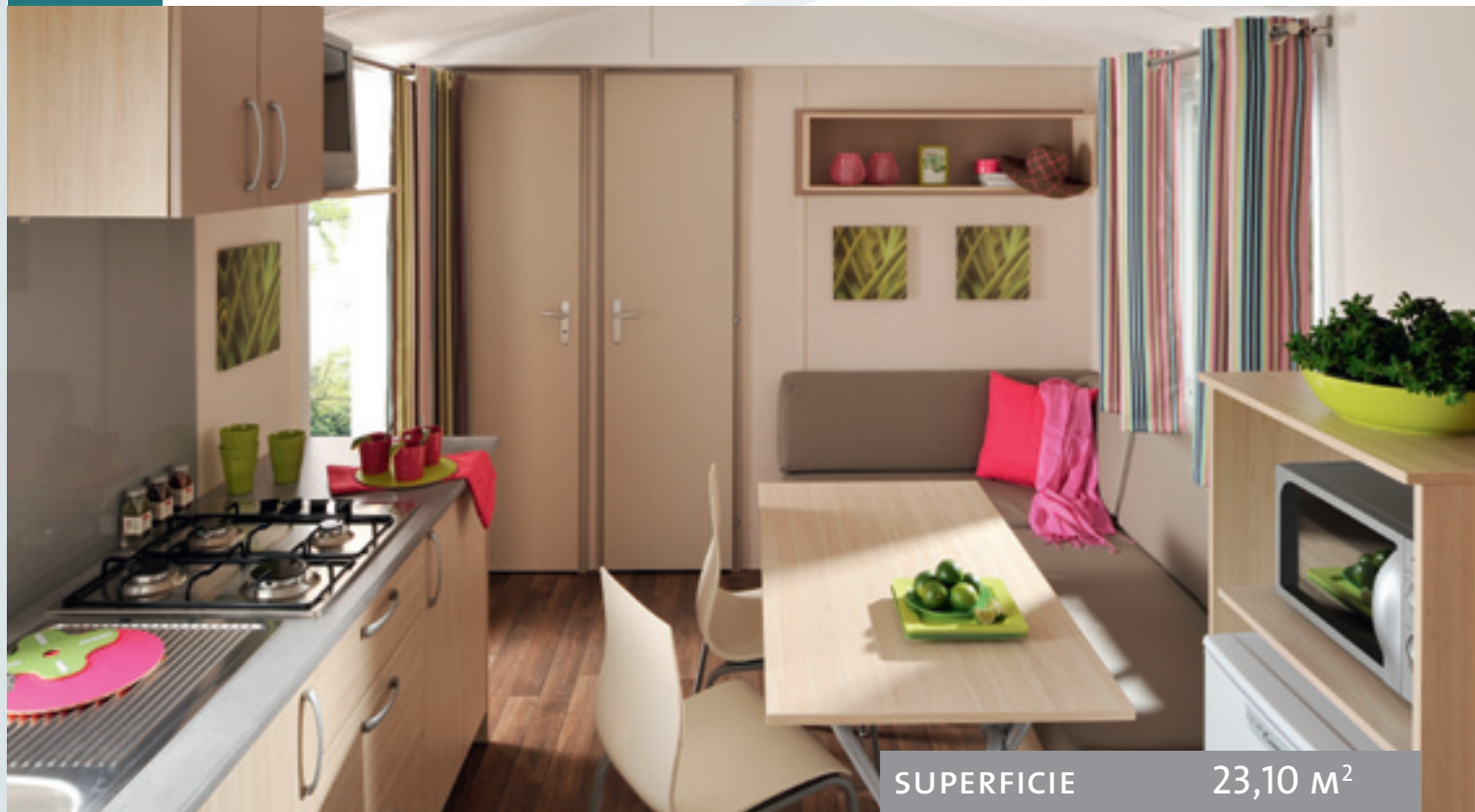
Ambiance présentée : FARNIENTE, rideaux Rayures Peps, assise Taupe.